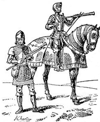
Илл. 4. Французские кулевринеры XV века – пехотинец и конный стрелок (Кулеврина 2016).

В этом контексте является естественным в слове «кулуврос» искать смысл «солдат, вооруженный кулевриной», т.е. «кулевринёр» (илл. 4).