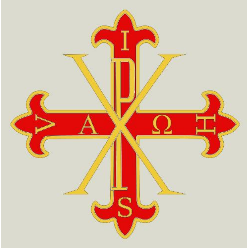
Imatge: Emblema de l'Orde Constantinià de Sant Jordi.