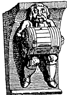
Фигура из церкви Saint-Gille, Malestroit (Бретань)

Рис. 7.21. Средновековни християнски „вакхически“ изображения, запазени до ден днешен в някои западноевропейски църкви. Например неприличните (според съвременните разбирания) изображения на свода на портала в църквата „Парижката Света Богородица“, Франция. После са изображенията на капитела в катедралата в Магдебург. Гола жена, яхнала козел, маймуна свири на китара. Отте, „Manuel de L'Archeologie de l'art religieux au moyen âge“. 1884. Ом [1064].