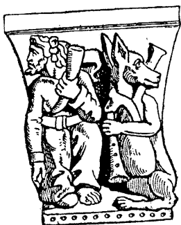
Деревянная скульптура из Malestroit (Бретань)