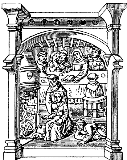
Миниатюра из моралистической библии (№ 166) из Императорской библиотеки