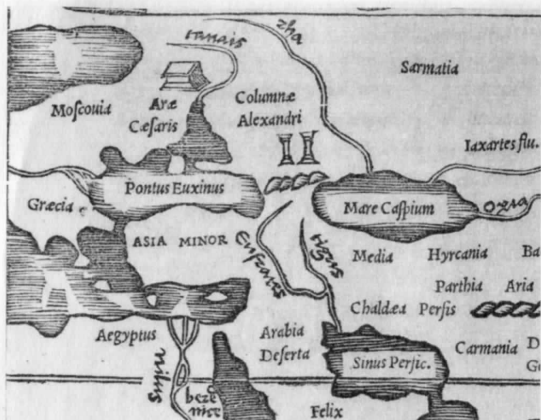
Рис. 5.39. Фрагмент от карта уж от 1538 г. От [1459], кола XXV, карта 71.