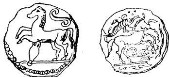
Рис. 3.23. Древни галски монети от книгата на John Blake „Astronomical Myths“, 1887 г. Вж. също [542], с. 14, ил. 8, 9.

примки. Показваме примките на Сатурн и Юпитер на рис. 3.20, рис. 3.21 и на Марс – рис. 3.22. Планетите спират, отстъпват назад и после сякаш ПАК СЕ ХВЪРЛЯТ НАПРЕД. Изглежда, това е предизвикало през древността сравнението им с КОНЕ, препускащи из кристалния небесен свод. Не е странно, че астрономията и астрологията са използвали този ярък образ в езика си.