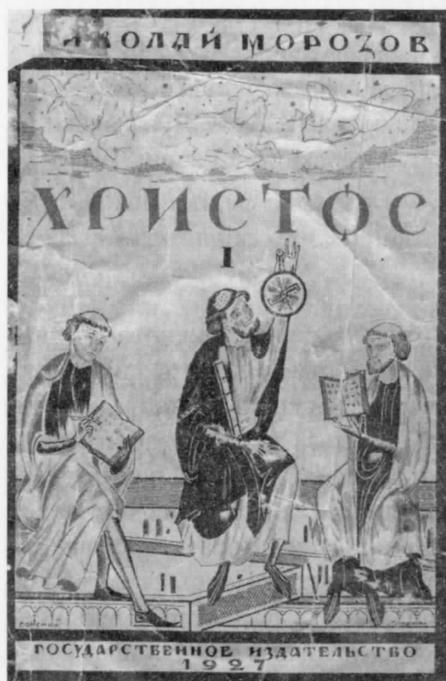
Рис. 1.23. Коричката на том първи от труда на Н. А. Морозов „Христос“, 1927 г.